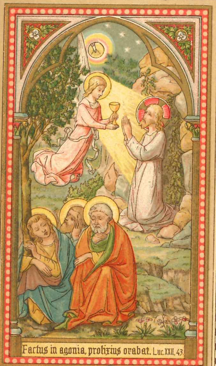
Factus in agonia, profertis orabat. Luc. XXII. 43